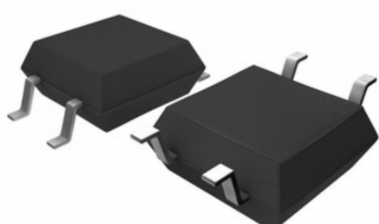
Bild kann Darstellung sein. Siehe Spezifikationen für Produktdetails.